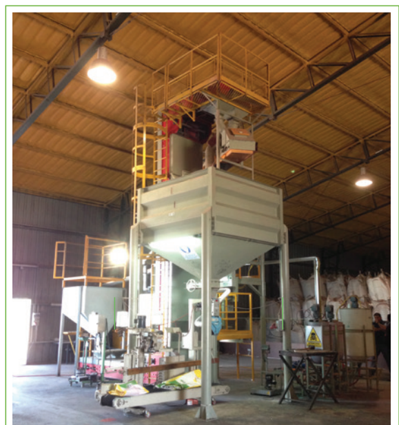
Localidad: Carmen de Areco, Bs. As.

Nitragin® ofrece a sus Centros de Tratamiento el servicio integral, asesoramiento, capacitación y la posibilidad de contar con equipamiento de última generación, para asegurar la calidad del tratamiento y preservar las semillas, dejándolas listas para sembrar.