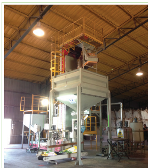
Localidad: Carmen de Areco, Bs. As.

Nitragin ofrece en sus Centros de Tratamiento el servicio integral, asesoramiento, capacitación y la posibilidad de contar con equipamiento de última generación, para asegurar la calidad del tratamiento y preservar las semillas, dejándolas listas para sembrar.